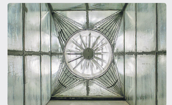
Le poste de ventilation mécanique Hermine