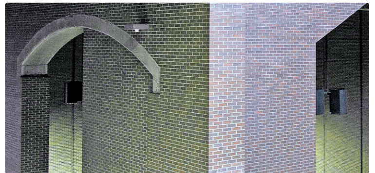
Une vue de la station Lucien-L'Allier.

IL Y A 40 ANS, LE 17 MARS 1978, DÉCÉDAIT LUCIEN L'ALLIER, INGÉNIEUR EN CHEF DU RÉSEAU INITIAL DU MÉTRO DE MONTRÉAL ET PRÉSIDENT-DIRECTEUR GÉNÉRAL DE LA COMMISSION DE TRANSPORT DE MONTRÉAL (CTM) DE 1964 À 1969 ET DE LA COMMISSION DE TRANSPORT DE LA COMMUNAUTÉ URBAINE DE MONTRÉAL (CTCUM) DE 1970 À 1974.