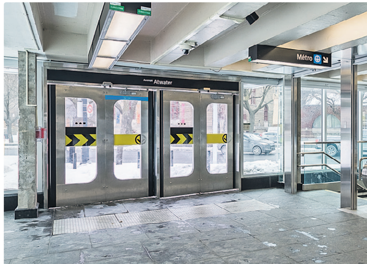
Deux portes papillon côte à côte, dans l'édicule nouvellement rénové du Square Cabot, à la station Atwater.