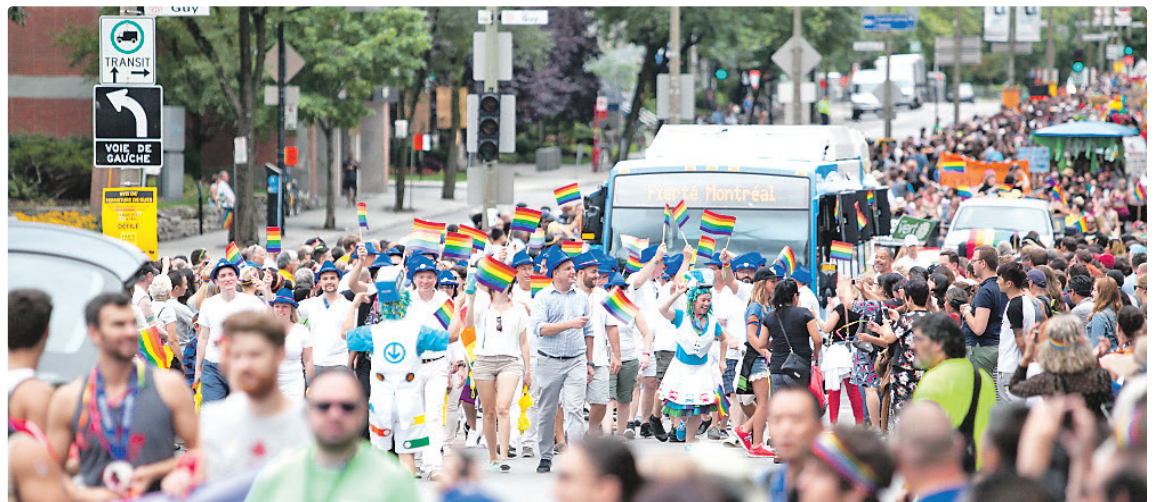
Notre cohorte a adoré participer au défilé de Fierté Montréal en 2016.

FIERS DE VOUS TRANSPORTER DANS MONTRÉAL, NOUS EMBARQUONS AVEC VOUS DANS LE DÉFILÉ DE FIERTÉ CANADA MONTRÉAL 2017 DU DIMANCHE 20 AOÛT. AVEC NOS GENS ET NOTRE BUS SPÉCIALEMENT MAQUILLÉ, NOUS COMPTONS RÉPÉTER L'EXPÉRIENCE VIBRANTE DE NOTRE PREMIÈRE PARTICIPATION L'AN PASSÉ.