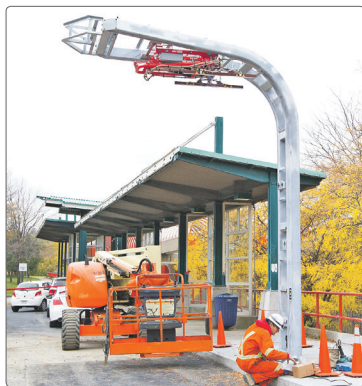
Station de recharge au terminus Angignon