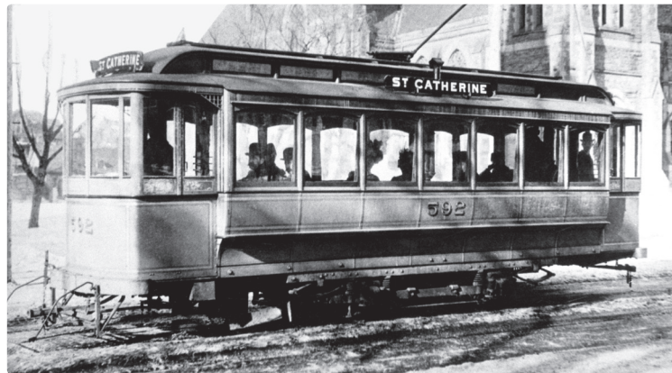
Un tramway montréalais aux environs de l'année 1900.

famille de services. Malgré tout, la vaste majorité des clients continuent de désigner leur ligne de bus par son numéro, même s'il a changé depuis 1924!