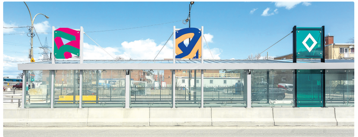
Abri SRB au coin de la 56 e Avenue

Pour l'horaire complet, visitez defisportif.com .