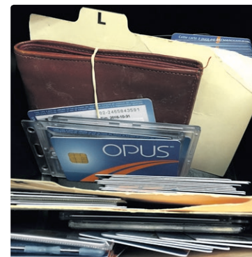
Vous n'êtes pas la seule personne à avoir égaré votre carte OPUS.

Même si ce n'est pas votre gant ou votre foulard, lorsque vous trouvez un objet, remettez-le au chauffeur ou à un agent de station. Ce dernier l'acheminera jusqu'à notre comptoir à Berri-UQAM.