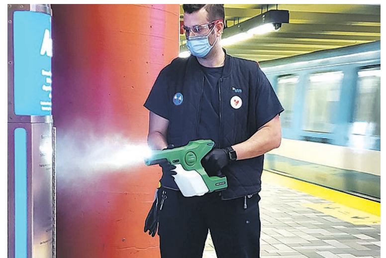
Désinfection d'une station de métro avec un pistolet électrostatique