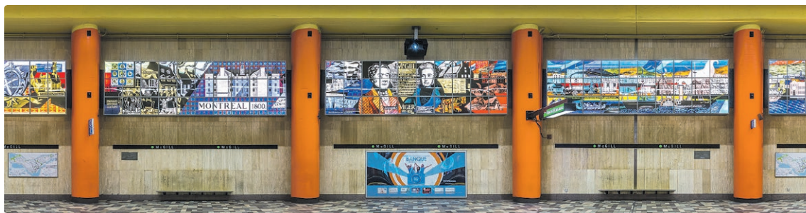
La verrière de Nicolas Sollogoub La vie à Montréal au XIX e siècle est une des œuvres déjà installées dans la station McGill.

LES ARTISTES PROFESSIONNELLS DU QUÉBEC SONT INVITÉS À SOUMETTRE LEUR CANDIDATURE D'ICI LE 8 OCTOBRE 2021, À 16 H.