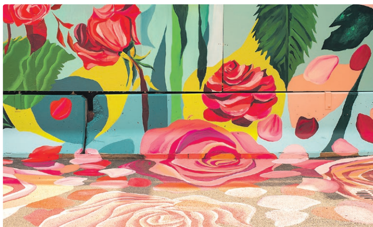
Les clôtures de chantier, les murets de béton et même le sol sont transformés en roseraie, grâce au travail des artistes.