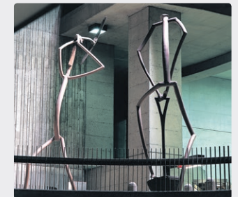
Pic et pelle , de Germain Bergeron à la station Monk.

Une belle collaboration... ... qui allait de soi puisque la Fabrique culturelle a pour mandat de valoriser l'art et la culture québécoise, et que le réseau de métro de Montréal regorge d'œuvres d'art.