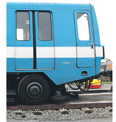
Le retour au bercail de la première motrice 79-501.

La vocation finale de cette première voiture de métro MR-73 reste à être précisée; la compagnie Alstom annoncera ses intentions plus tard cette année.