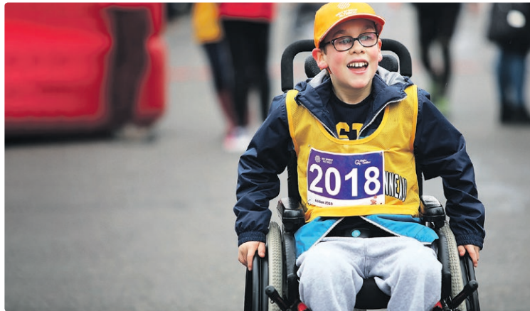
Un participant au Défi sportif AlterGo.

L'événement sera lancé avec une cérémonie d'ouverture virtuelle, le 26 avril. Au cours de la semaine, deux événements virtuels mettant en vedette des panélistes inspirants seront présentés. Les