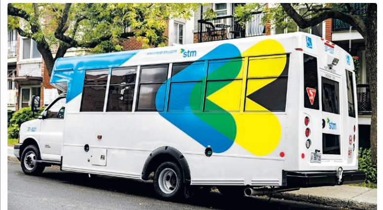
Les déplacements de nos clients du Transport adapté s'effectuent avec des minibus comme celui-ci et par l'intermédiaire de partenaires de l'industrie du taxi, avec des véhicules adaptés et des berlines.