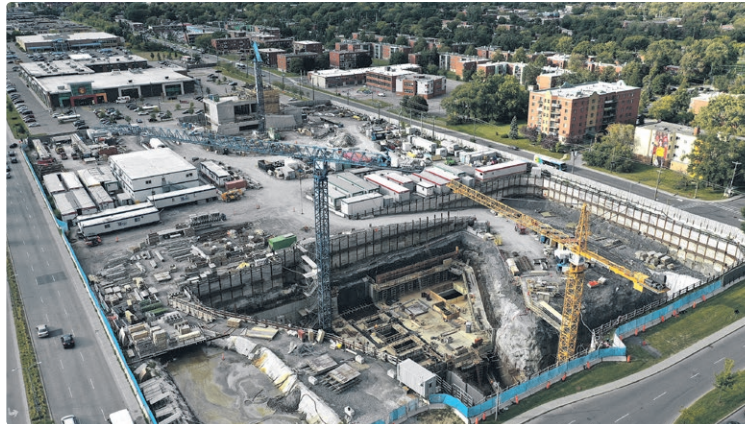
Creusé dès la mobilisation sur le site, le faisceau constitue l'accès principal à ce vaste chantier souterrain.

Rappelons que ce projet, débuté en 2017, consiste en la construc-