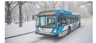
Quel parc traverse ce bus?

Du boulevard Rosemont jusqu'au parc Lafontaine, on vous suggère la rue Christophe-Colomb. Entre les deux parcs, vous pourrez certainement vous offrir un gobelet de votre breuvage chaud favori en passant sur la rue Laurier ou la rue Mont-Royal. Quelle belle journée!