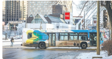
Quel est l'édifice avec des verrières qu'on voit juste derrière le bus?

Sur la rue Sherbrooke, c'est le Mile carré doré et son architecture distinctive. Sur la rue Sainte-Catherine, les grands magasins abondent. Autour de la Place-des-Arts, les installations du Quartier des spectacles déploient les couleurs de Luminothérapie. Ça vaut au moins une journée, parce qu'il y a beaucoup à faire et à voir!