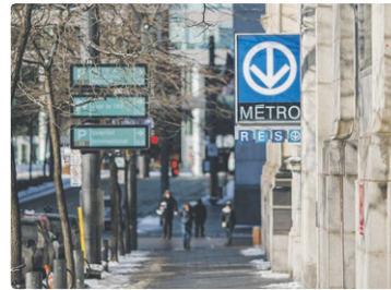
Voilà l'entrée d'une des stations de métro du secteur. De laquelle s'agit-il?

du Vieux-Montréal, un quartier particulièrement joli lorsqu'il neige.