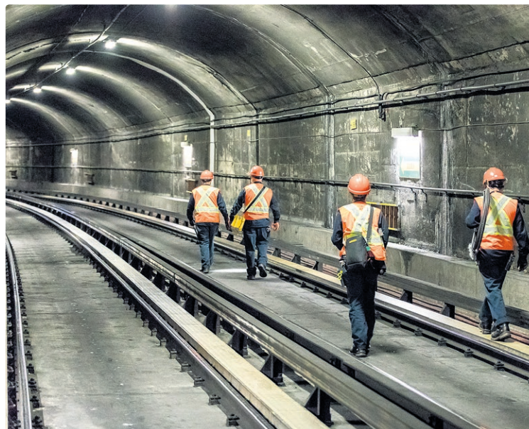
03. Des équipements spécialisés se trouvent dans des locaux techniques aménagés à des emplacements stratégiques du réseau du métro pour permettre une couverture mobile optimale. C'est à cet endroit que la magie s'opère : les différents signaux utilisés par les partenaires du projet, Bell, Rogers, Telus et Vidéotron, sont combinés grâce au réseau de fibre optique de la STM et redéployés pour permettre une distribution optimale vers le réseau souterrain du métro, grâce à des antennes et au câble radiant.