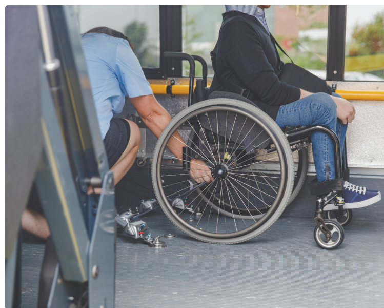
Dans un minibus du transport adapté, le chauffeur doit installer et retirer les attaches qui immobilisent un fauteuil roulant pendant le transport.