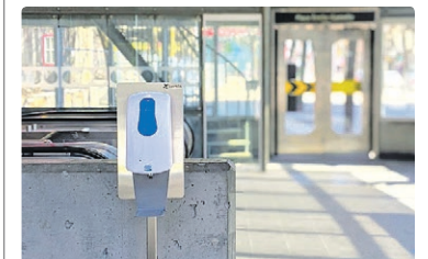
Un distributeur dans un édicule de la station Berri-UQAM

Nous vous invitons à les utiliser à votre entrée dans le métro et en sortant. Cette mesure est complémentaire à un lavage des mains avec du savon, un geste que nous vous invitons à poser régulièrement. En plus de porter un couvre-visage, il s'agit là d'une des bonnes habitudes à prendre pour éviter toute transmission du virus dans un lieu public comme le métro.