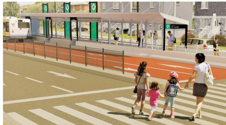
Un aperçu d'une future station SRB

La mise en service du parcours original entre Laval et l'avenue Pierre-de-Coubertin est prévue pour 2022. Le nouveau tronçon de 1,7 km entre l'avenue Pierre-de-Coubertin et la rue Notre-Dame Est, annoncé en décembre 2019, s'ajoutera en 2023.