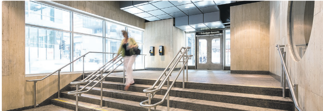
La station McGill compte 6 édicules

CES TRAVAUX COMMENCERONT À LA MI-FÉVRIER, ET CE, JUSQU'AU PRINTEMPS 2022.