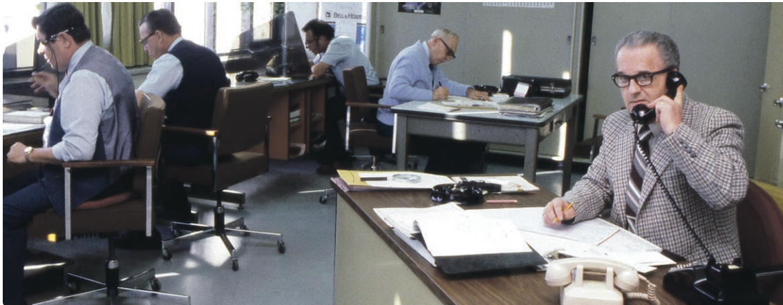
Cette photo de notre centre de renseignements à la clientèle en 1980 nous montre que si les façons de s'informer ont évolué depuis ce temps, les appareils téléphoniques ont bien changé eux aussi !

EN JANVIER 1980, LA COMMISSION DE TRANSPORT DE LA COMMUNAUTÉ URBAINE DE MONTRÉAL (CTCUM) ADOPTAIT LE NUMÉRO DE TÉLÉPHONE A-U-T-O-B-U-S (514 288-6287) POUR SON CENTRE DE RENSEIGNEMENTS À LA CLIENTÈLE.