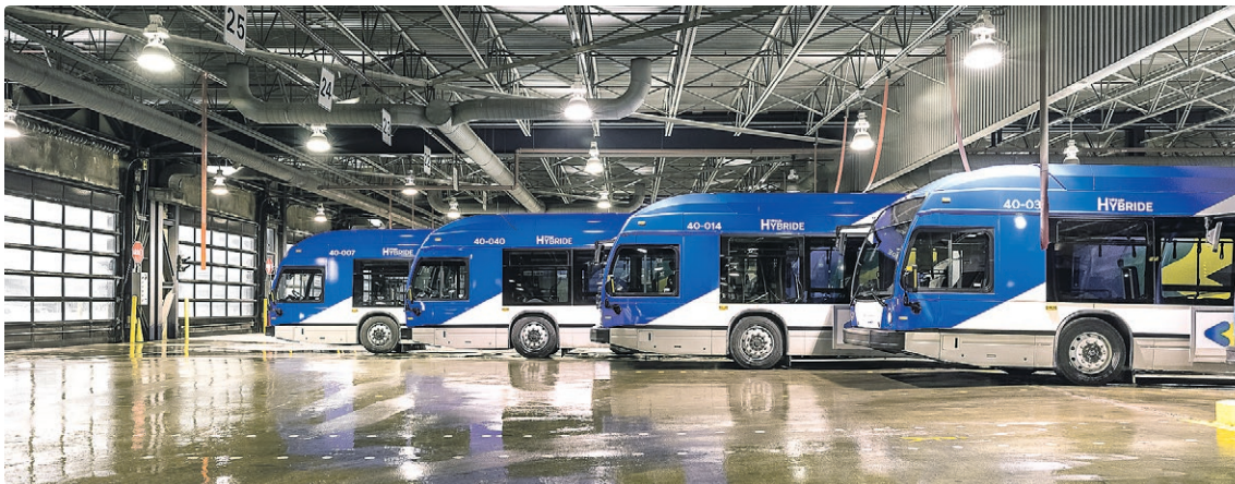
Nos plus récents modèles de bus, à l'intérieur de notre centre de transport LaSalle.

AU TOTAL, 300 NOUVEAUX VÉHICULES S'AJOUTERONT À NOTRE PARC DE BUS AU COURANT DE L'ANNÉE. LA LIVRAISON SE POURSUIT À RAISON D'UNE MOYENNE DE 30 VÉHICULES PAR MOIS.