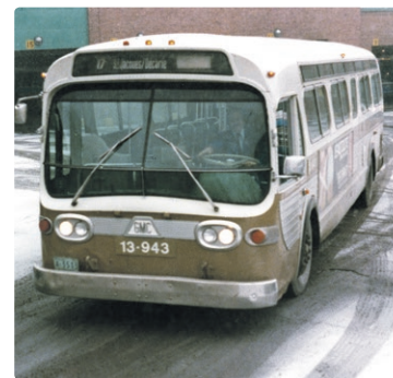
Les premiers bus de type New Look qui circulaient dans les rues montréalaises portaient une couleur cuivrée.

Vous aimez nos photos? Nous en publions encore plus sur notre page Facebook : facebook.com/stminfo .