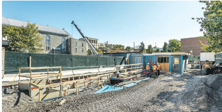
L'édicule temporaire, avant qu'il ne soit ouvert au public. On peut aussi voir la fondation du mur du futur édicule.

Nous avons d'abord construit un abri, à l'intérieur de l'édicule de la station. Grâce à cet abri, nous avons pu démolir l'ancien édicule. Cet abri était bien sûr très robuste, car il a supporté en partie le toit de l'ancien édicule, que nous avons ensuite défilé, bloc par bloc.