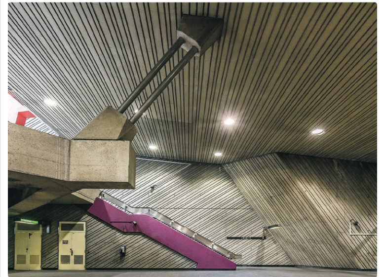
La station Lasalle. Architectes : Gillon et Larouche. Œuvre : murale de Peter Gnass.

ILS SONT PLUSIEURS À AVOIR LAISSÉ LEUR MARQUE DANS LE RÉSEAU DE MÉTRO MONTRÉALAIS. ARCHITECTES ET ARTISTES ONT CONTRIBUÉ À LA RENOMMÉE DE NOS 68 STATIONS.