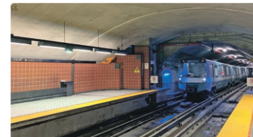
L'arrière-gare de la station Saint-Michel vue des quais.

chaleur qui nuit à la précision des instruments laser utilisés pour l'opération, nous devons la fermer les 21 et 22 septembre.