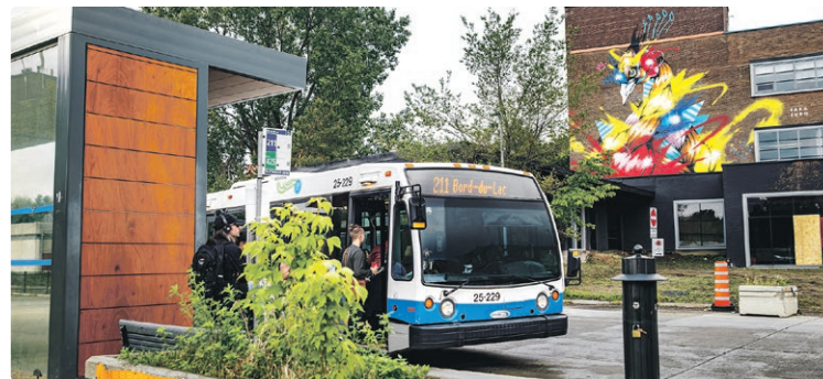
Embarquement à la station Lionel-Groulx.

Après quelques arrêts dans la municipalité de Dorval, on a l'occasion d'apercevoir le lac Saint-Louis dès Pointe-Claire, un endroit où le fleuve s'élargit pour donner au lieu un caractère marin. On gagne ensuite le boulevard Beaconsfield pour traverser la municipalité du même nom. Cette artère achalandée n'est jamais très loin de la rive et à certains endroits, comme au parc Centennial, le marcheur a un accès au rivage par un parc paisible. De Baie-d'Urfé jusqu'à Sainte-Anne-de-Bellevue,