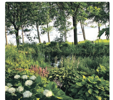
Un étang verdoyant de la baie d'Urfé.

on est sur le chemin Lakeshore qui, comme son nom l'indique, suit la rive. Au-delà du fleuve, c'est l'île Perrot.