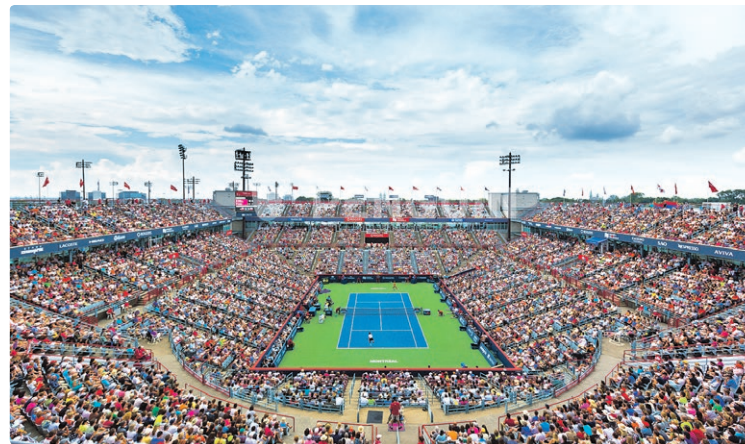
Une édition antérieure de la coupe Rogers au stade IGA.

Que vous preniez le bus ou le métro, tous les jours ou seulement à l'occasion, vous êtes invités à donner votre opinion.