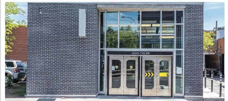
L'édicule équipé d'un ascenseur est situé au 430, rue Jean-Talon Est.

Ces travaux sont effectués notamment grâce au financement octroyé par le ministère des Transports du Québec et par Infrastructure Canada dans le cadre du Programme Fonds Chantiers Canada-Québec.