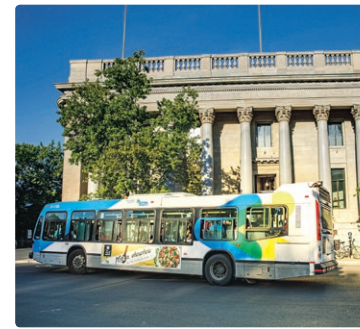
Le bâtiment historique du Conseil des arts de Montréal, sur la rue Sherbrooke.