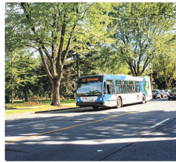
Le parc La Fontaine, coin Sherbrooke et Papineau, est un excellent endroit où se prélasser cet été.

Puis, c'est la municipalité de Westmount. La ligne longe le parc du même nom où sont regroupés des édifices logeant des institutions de la ville, dont la magnifique bibliothèque de Westmount et le Victoria Hall. Le bel hôtel de ville arrive bientôt, puis peu après ce secteur tout en verdure, on croise la rue Greene qui invite à flâner avec ses cafés et restos.