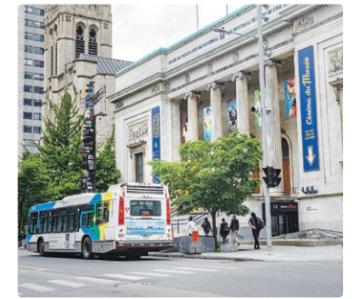
Le Musée des beaux-arts de Montréal.

« C'est une ligne assez majeure, une ligne qui dessert plusieurs universités, des hôpitaux, des cliniques et des consults. On a une clientèle très variée. »