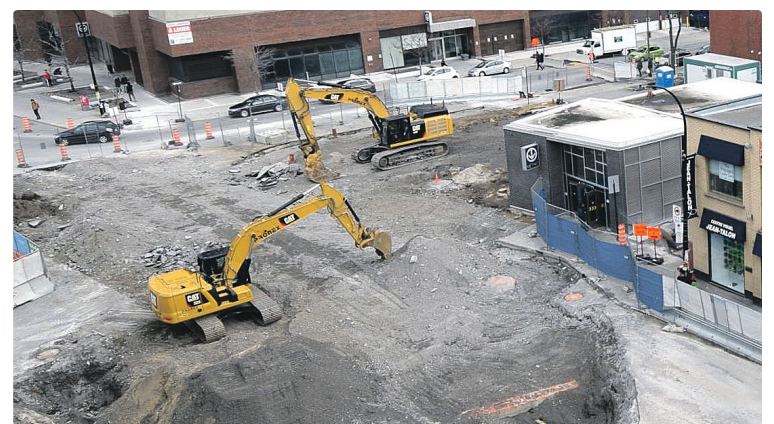
L'édicule équipé d'un ascenseur est situé au 430, rue Jean-Talon Est.

Ces travaux sont effectués notamment grâce au financement octroyé par le ministère des Transports du Québec et par Infrastructure Canada dans le cadre du Programme Fonds Chantiers Canada-Québec.