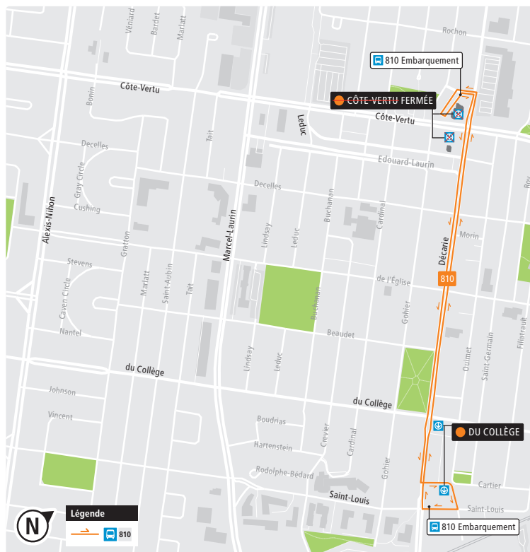
Le trajet du service de navette par bus entre les stations Côte-Vertu et du Collège le samedi 13 et le dimanche 14 avril.

Un service de navette reliera, au tarif habituel, la station Côte-Vertu à la station Du Collège. Elle sera en fonction pendant les heures d'ou-