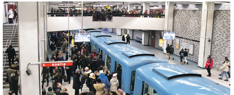
La station Place-des-Arts est toujours l'un des points les plus animés de la ville lors de la Nuit blanche.

Pour qui n'a pas un titre de transport pour l'occasion, nous suggérons Soirée illimitée. Pour seulement 5,25$, ce titre pratique permet à son détenteur des déplacements illimités en bus et en métro, entre 18 h et 5 h.