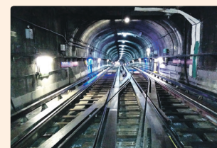
Un appareil de voie en arrière-gare

La manœuvre de retournement, c'est le mouvement qu'effectue le train, d'une voie vers une autre. Pour réaliser ce mouvement, le train emprunte un appareil de voie, tel qu'illustré sur la photo.