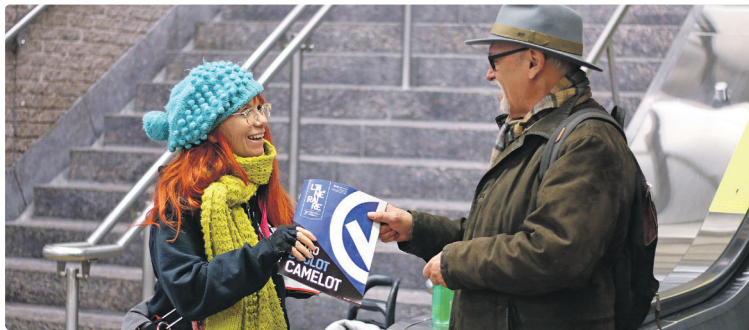
Jo, camelot de l'Itinéraire à la station McGill.

DEPUIS TROIS ANS ET DEMI, JO EST À LA RENCONTRE DES TRAVAILLEURS QUI TRANSITENT PAR LA STATION MCGILL.