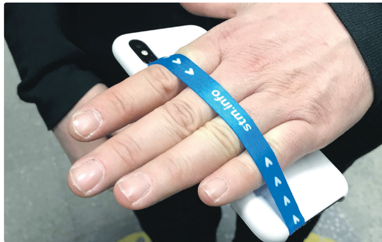
Ces sangles s'installent facilement et permettent de garder solidement en main son téléphone, réduisant le risque de l'échapper accidentellement.

Nos gens qui se déplaceront dans les stations ciblées durant ces périodes seront facilement identifiables.