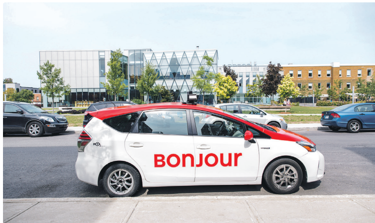
Ce service est développé en collaboration avec les compagnies concessionnaires de taxi.

Le transport collectif par taxi est une forme de transport public adaptée aux quartiers où il n'est pas possible d'implanter un service d'autobus régulier. Pour tous les détails sur les règles d'utilisation, les modalités de réservation et les zones desservies, consultez la page stm.info/taxi