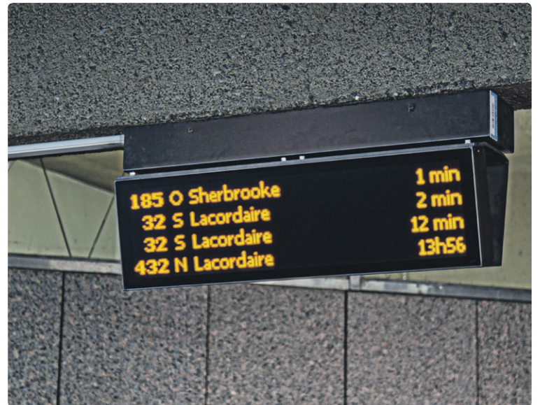
La diffusion d'information en temps réel pour nos lignes de bus figure parmi les avancées technologiques récemment mises à votre disposition pour optimiser vos déplacements.