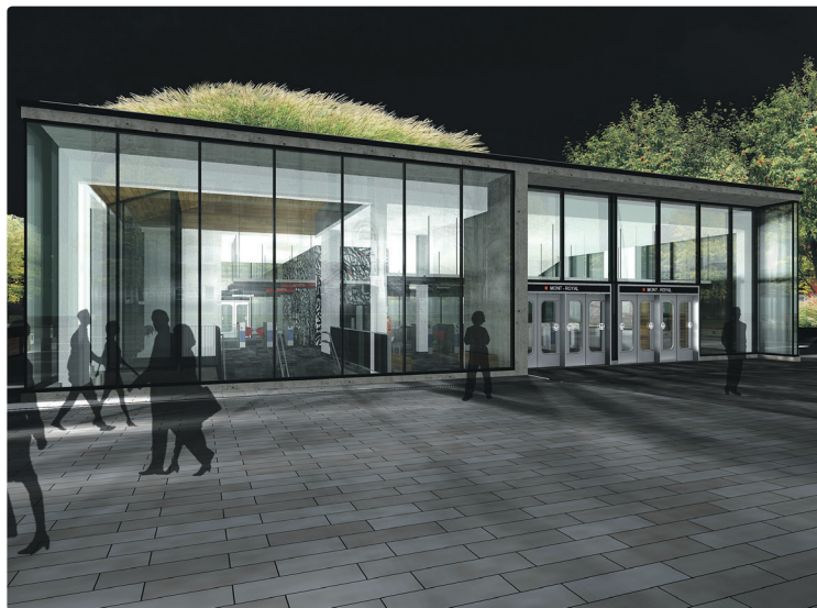
Façade de la station la nuit, une fois les travaux terminés

Les travaux à la station Mont-Royal sont effectués notamment grâce au financement octroyé par le ministère des Transports, de la Mobilité durable et de l'Électrification des transports.