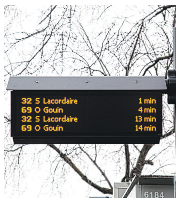
Une borne d'information

Jeudi soir dernier, les membres du Syndicat des chauffeurs de bus, des opérateurs de métro et des employés des services connexes ont adopté à 82%, en assemblée générale, une nouvelle convention collective de sept ans. L'entente a été ratifiée par le conseil d'administration de la STM vendredi matin. Les clauses de la convention nous permettront d'avoir une plus grande flexibilité dans l'organisation du travail, favorisant ainsi une livraison du service fiable et performante au plus grand bénéfice des clients.