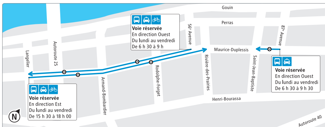
Nouvelle voie réservée sur le boulevard Maurice-Duplessis

À COMPTER DU MERCREDI 3 OCTOBRE, UNE NOUVELLE VOIE RÉSERVÉE POUR BUS, TAXIS ET VÉLOS SERA MISE EN SERVICE SUR LE BOULEVARD MAURICE-DUPLESSIS, ENTRE LES BOULEVARDS LANGELIER ET RIVIÈRE-DES-PRAIRIES AINSI QU'ENTRE LE BOULEVARD SAINT-JEAN-BAPTISTE ET LA 87 E AVENUE (DIRECTION OUEST POUR BUS ET TAXIS UNIQUEMENT).