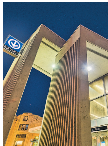
La station de l'Église