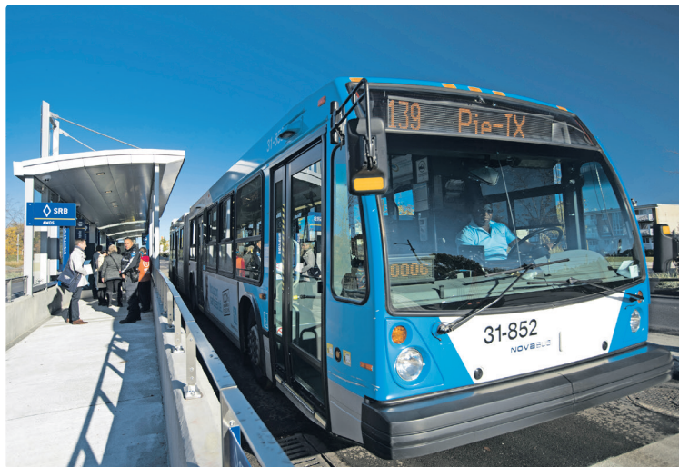
La station prototype Amos a été mise en service en octobre 2016.

Le SRB sera doté de stations équipées de technologies de pointe permettant d'informer les voyageurs en temps réel sur les prochains pas-