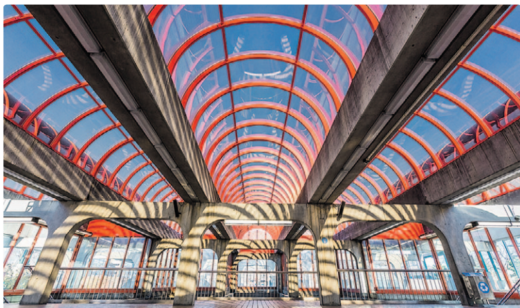
La station Angrignon