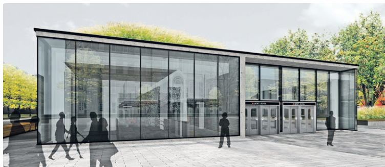
Façade de la station une fois les travaux terminés.

DÈS LA FIN SEPTEMBRE, UN VASTE PROJET VA S'AMORCER À LA STATION MONT-ROYAL. DÉCOUVREZ CE QUI ATTEND CETTE STATION DE LA LIGNE ORANGE.