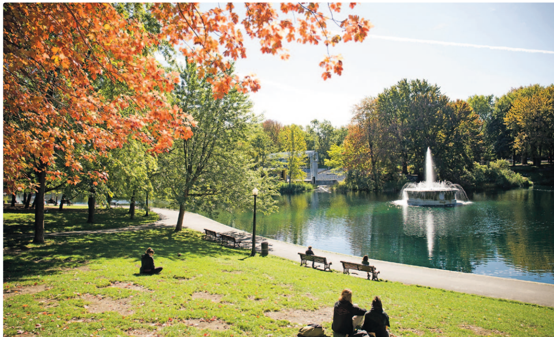
Plateau Mont-Royal et Mile End - Parc Lafontaine.

La ligne 711 relie les stations de métro Snowdon et Mont-Royal à deux attractions emblématiques de Montréal. Conservez votre énergie pour vos promenades dans les sentiers du parc du Mont-Royal et pour gravir les marches de l'Oratoire, on vous y emmène tous les jours!