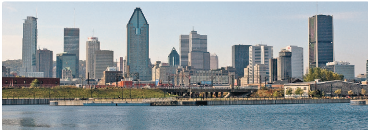
Montréal offre plusieurs points d'eau, comme ici, au Bassin Peel du canal de Lachine - Pôle des Rapides.

NOS RÉSEAUX DE BUS ET DE MÉTRO VOUS EMMÈNENT AUX QUATRE COINS DE LA VILLE. LAISSEZ-VOUS TRANSPORTER, MONTRÉAL REGORGE DE LIEUX MAGNIFIQUES À DÉCOUVRIR... OU REDÉCOUVRIR.