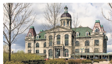
Marché Maisonneuve.

Après le boulevard Pie-IX, le passé de l'ancienne ville de Maisonneuve donne à l'endroit des airs surprenants. Voyez l'édifice de la bibliothèque Maisonneuve, au coin Pie-IX/Ontario, et un peu plus loin, l'édifice du marché Maisonneuve et le majestueux bain Morgan, sur la rue du même nom. Visible de