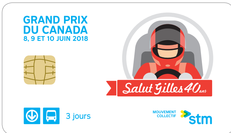
Le titre de transport spécial édité pour l'événement, valide pendant trois jours, du vendredi 8 au dimanche 10 juin 2018.

Le vendredi 8 juin, le titre sera en vente dans toutes les stations suivantes :