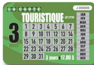
3 jours de transport STM