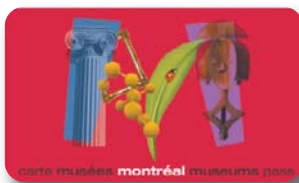
3 jours de musées