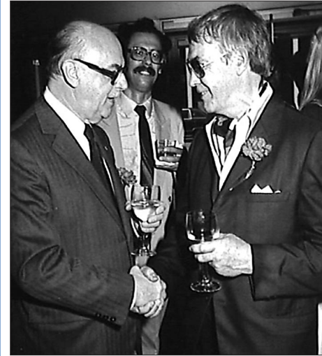
Le maire Jean Drapeau et l'artiste Maurice Lemieux lors du dévoilement d' Enterspace , en juillet 1981.