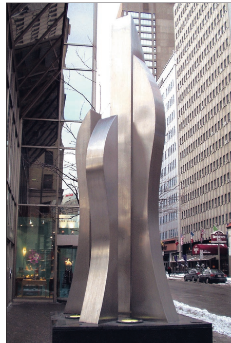
Enterspace , sculpture du même artiste située à proximité de la station Peel.

« Comme toujours, mon père a réalisé l'œuvre lui-même dans son atelier situé sur la terre paternelle à Valleyfield. Il a d'abord découpé les pointes en acier inoxydable de la sculpture, comme on le fait avec un patron de robe... mais en beaucoup plus grand et au millimètre près! Ensuite, il a soudé toutes les pièces ensemble. » Réalisée en 1981, l'œuvre de Maurice